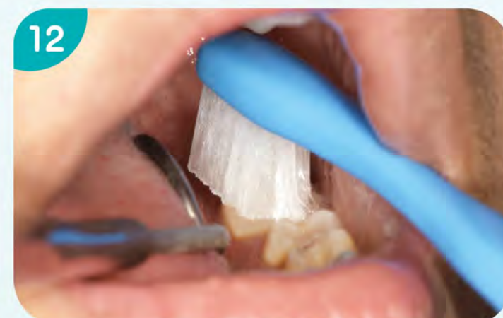
12. 刷左下顎咬合面，也是兩顆兩顆來回刷。