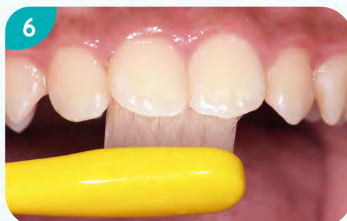
6. 刷上顎前牙舌側面。