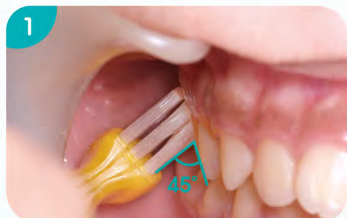
1. 右上顎頰側面開始，刷毛與牙面成 45^{\circ} \sim 60^{\circ} 。