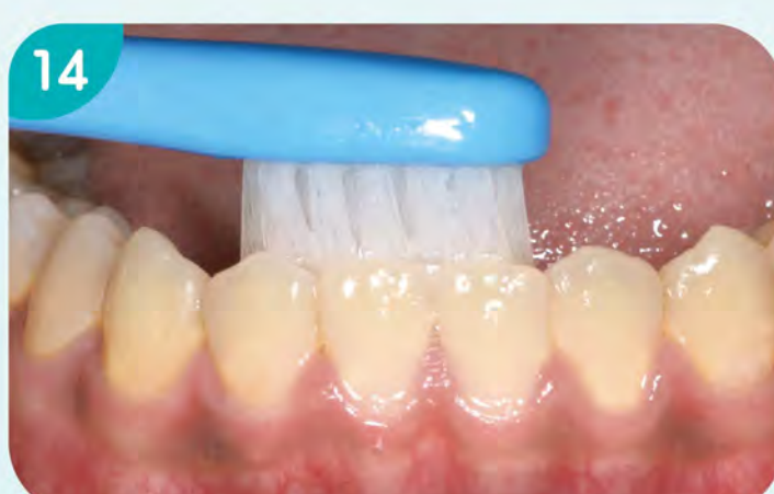
14. 刷下顎前牙舌側面。