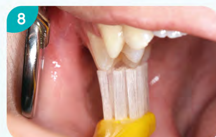
8. 刷右上顎咬合面。到此，刷牙是由右邊開始，也在右邊結束。