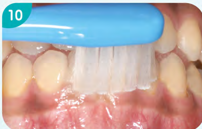
10. 刷下顎前牙唇側面。