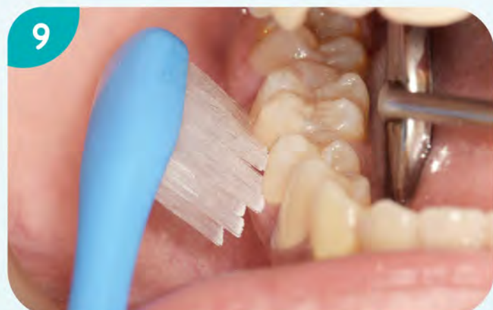
9. 用同樣的方法及順序，由右下顎頰側面開始。