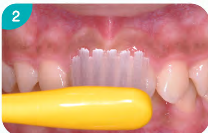
2. 刷上顎前牙唇側面。