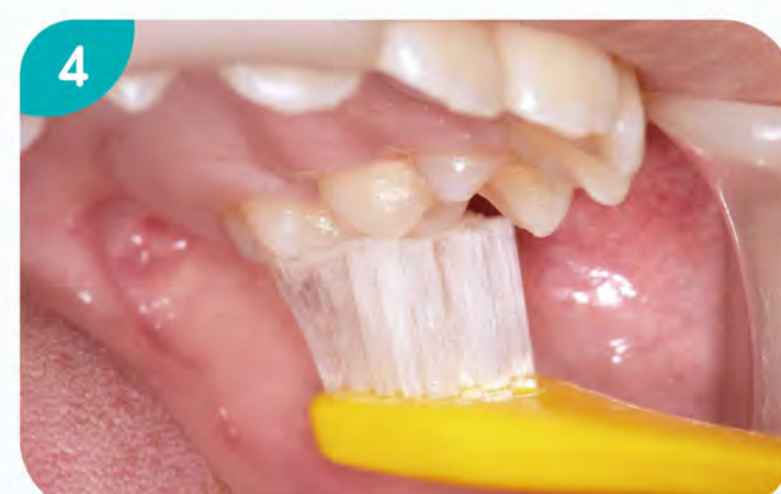
4. 刷左上顎咬合面，也是兩顆兩顆來回刷。