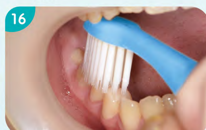
16. 刷右下顎咬合面。到此，刷牙是由右邊開始，也在右邊結束。